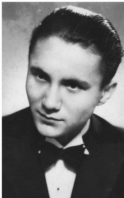
Ako maturant v školskom roku 1943-1944