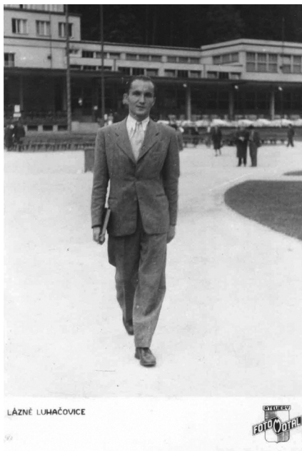
V kúpeľoch Luhačovice