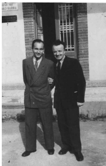
V areáli VŠV v Košiciach